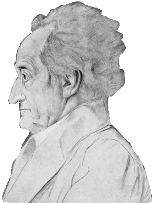
Johann Wolfgang von Goethe

Gekürzte Fassung der Spielgemeinschaft Odyssee